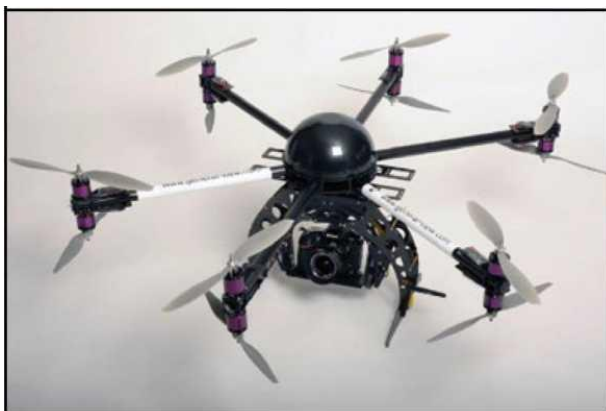
Рис. № 5 - многооторный БПЛА.

Тип БПЛА, который с каждым днем получают все большее распространение, - многооторные системы. Их еще называют мультикоптерами, квадрокоптерами, гексакоптерами, октакоптерами и тому подобное, в зависимости от количества несущих винтов. Характерная особенность - многооторная система, принцип полета - подобен вертолетному (рис. № 5).