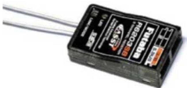
Рис. № 11 - Приемник аппаратуры управления.

Видеопередатчик (рис. № 10) - это устройство, передающее на наземную станцию изображение с камер БПЛА. Является самым заметным устройством на борту БПЛА, поэтому без необходимости включать его не стоит (это касается только тех БПЛА, которые хранят фотографии на борту), соблюдая режим радиомолчания. Такой режим уменьшает возможность применения противником средств РЭБ.