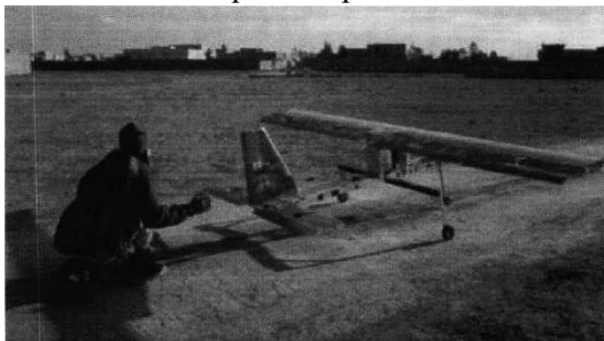
Рис. № 4 - малогабаритный летательный аппарат.

БВС-камикадзе является весьма специфичным классом беспилотной техники, информация о котором чаще всего носит секретный характер. Такой дрон представляет собой малогабаритный летательный аппарат (рис. № 4), способный нести несколько килограмм взрывчатки.