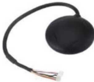
Рис. № 8 - Модуль GPS-навигации.

Рассмотрим радиопередающие системы, установленные на БПЛА.