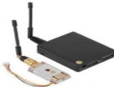
Рис. № 10 - Видеопередатчик.

Видеопередатчик (рис. № 10) - это устройство, передающее на наземную станцию изображение с камер БПЛА. Является самым заметным устройством на борту БПЛА, поэтому без необходимости включать его не стоит (это касается только тех БПЛА, которые хранят фотографии на борту), соблюдая режим радиомолчания. Такой режим уменьшает возможность применения противником средств РЭБ.