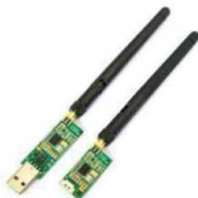
Рис. № 9 - Модем телеметрии.

Модем телеметрии (рис. № 9) - приемное устройство, предназначенное для обмена информацией между наземной станцией и БПЛА. От наземной станции он посылает команды к выполнению, от БПЛА - принимает на наземную станцию информацию, получаемую с датчиков (например, скорость, потребление тока, напряжение, положение в пространстве. Обычно является основным каналом управления БПЛА.